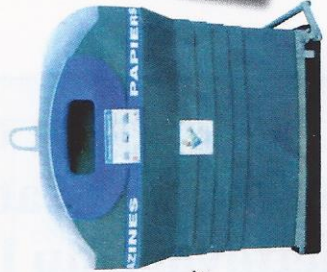
Colonne à papiers

Toutes les enveloppes, à l'exception des enveloppes "Kraft" (enveloppes marron) sont à jeter dans la colonne à papiers située sur votre commune.